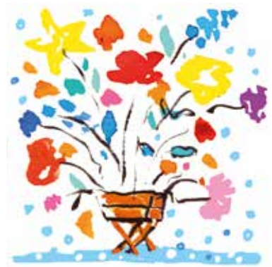
Grafiken: © Pfeifer