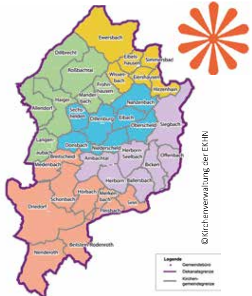
Karte des Dekanats an der Dill: Erstellt von der Kirchenverwaltung der EKHN, Referat für Kirchliche Daten, Fundraising und Mitgliederorientierung, Stand 9/2023