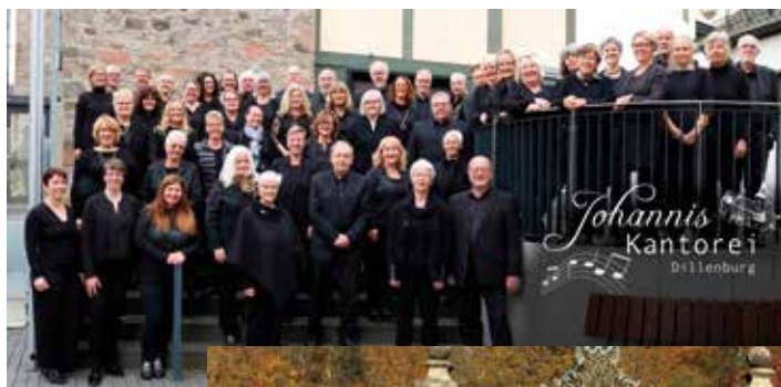
Eine besondere Mischung: Die Johanniskantorei Dillenburg und die Herborner Kantorei singen gemeinsam

An der Abendkasse kosten die Karten 22 € (ermäßigt 18 €). Einlass ab 16 Uhr, freie Platzwahl.